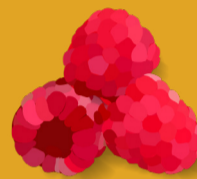
Framboise Juin - septembre