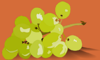
Raisin Septembre - octobre