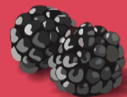
Mûre Juillet - septembre