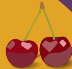
Cerise Juin - août