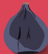
Figue Juillet - septembre