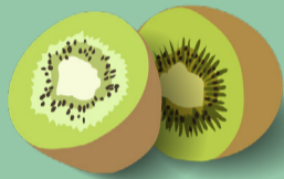
Kiwi Novembre - mars