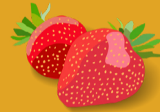
La fraise Juin - septembre