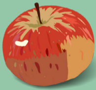
Pomme Août - mai