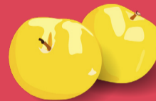
Mirabelle Août - septembre