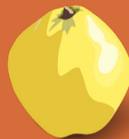
Coing Septembre - novembre