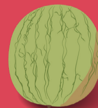
Melon Juin - septembre