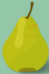
Poire Août - mars