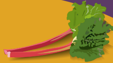
Rhubarbe Avril - juin