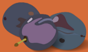
Pruneaux Août - septembre