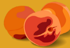
Abricot Juin - août